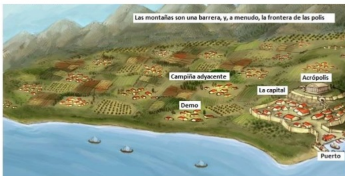
Modelo de una polis griega

En dicho marco, los ciudadanos tenían conciencia de participar de una misma comunidad territorial y política, alcanzando poco a poco (en gran parte de las polis , al menos) el control de la mayoría de los asuntos de la misma. La primera forma de gobierno de las polis fue la monarquía, si bien pronto debió de hacerse con el poder en ellas y con sus órganos de gobierno la aristocracia, poseedora de las tierras mejores y más extensas de la misma. Ellos administraban también la justicia según códigos no escritos. Frente a los nobles, los pequeños campesinos vivían una situación de clara dependencia de estos, por lo que podían convertirse en esclavos suyos e, incluso, ser desterrados de la polis , si no les abonaban la renta debida o no les devolvían el dinero prestado.