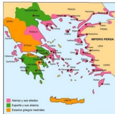
Guerra del Peloponeso

En efecto, el ambicioso rey de Macedonia, Filipo II, tras organizar un ejército poderoso y disciplinado y eliminar a sus posibles rivales, aprovechando la debilidad y división que seguían mostrando las polis griegas cincuenta años después de la Guerra del Peloponeso , conquistó algunas colonias griegas del norte del Egeo, y su intervención posterior en Tesalia, aliado con Aenados de Larisa, le permitió ejercer el control sobre ella a partir de 352 a.C. Finalmente, a raíz de su participación en la Tercera Guerra Sagrada , fue admitido en la Anfictiónia de Delfos , convirtiéndose pronto en árbitro de todos los asuntos de la Hélade. A la actuación de Filipo, las polis solo opusieron veleidades y vacilaciones, a pesar de las denuncias de Demócstenes, perdiendo definitivamente su libertad en la Batalla de Queronea el año 338 a.C.