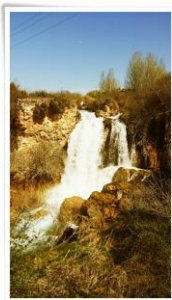
Lagunas de Ruidera

Todo un lujo compartir con una compañía de teatro sus experiencias.