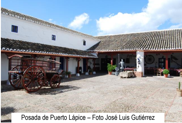
Posada de Puerto Lápice

Estaban acaso a la puerta dos mujeres mozas, de esas que llaman del partido, las cuales iban a Sevilla con unos arrieros [...].