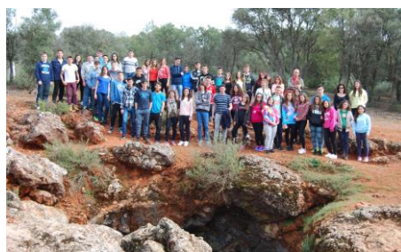
Cueva de Montesinos

Y fue así que nos dispusimos a otra aventura: entrar en la famosa “Cueva de Montesinos” donde nuestro caballero, se dice, que vivió una grandiosa aventura. No nos descolgamos por una cuerda sino que bajamos por unos resbaladizos escalones. Húmeda y sólo iluminada por nuestras linternas, la ocupamos y rememoramos la visita de nuestro ya, en ese momento, buen amigo don Quijote.