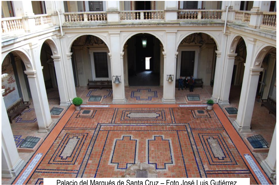
Palacio del Marqués de Santa Cruz

como arriba, demostraba gusto y un saber propio de un hombre del Renacimiento. Los techos de las galerías estaban pintados (y con la pintura original conservada) con escenas mitológicas de gran belleza. Nos sorprendieron todos y