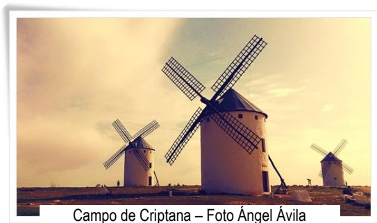
Campo de Criptana

Y, ya nos vamos, como don Quijote a nuestra aldea. Para ello pasamos antes por el Campo de Criptana para visitar el famoso Cerro de los Molinos. Nos armamos de valor para esta aventura sin par: derrotar a esos gigantes quijotescos que agitaban sus brazos