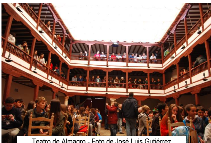
Teatro de Almagro

Aunque el cansancio quería derrotarnos (los jóvenes aprendices de D. Quijote no saben de descanso) tuvimos tiempo suficiente para descansar en la plaza de Almagro. Allí, ya repuestos, visitamos el casco antiguo de Almagro: son dignas de ver sus casas