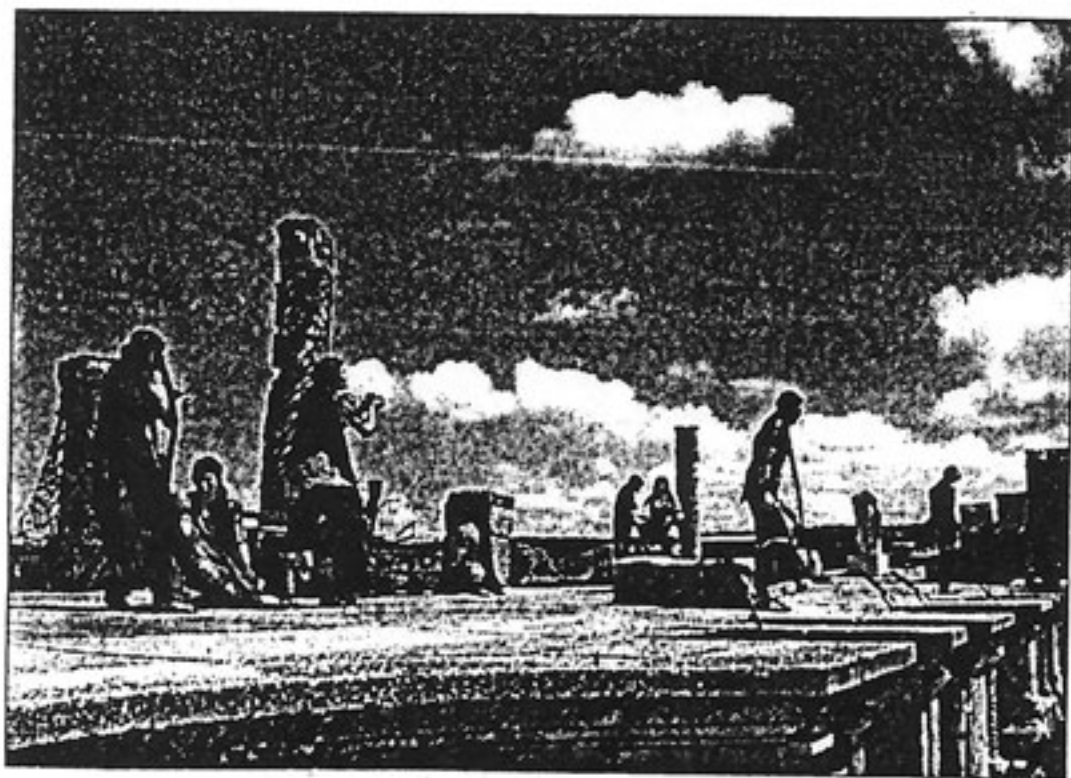
El grupo albaceteño "Adynaton" ofreció una excelente representación.

Todos ellos han vuelto a dar vida al teatro clásico grecolatino desde este XX Festival que se clausura a finales de junio con dos sesiones que además incluyen un espectáculo de danzas griegas. Para entonces, la organización del Festival se reserva un segundo homenaje destinado a las asociaciones de mujeres de toda la provincia de Cuenca por el apoyo que con su presencia han depurado al Festival de Teatro Grecolatino de Segóbriga y la sensibilidad mostrada ante sus representaciones.